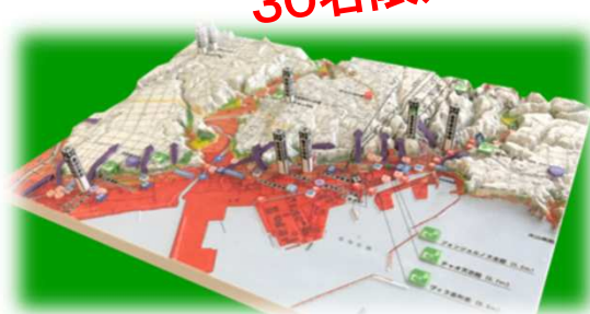
3D立体ハザードマップ ®